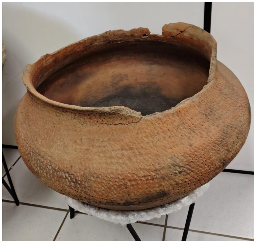
Figura 3. Urna funerária da cerâmica Guarani.

Na perspectiva da cultura material, a cerâmica tinha muitas funcionalidades, tanto nos usos domésticos, para a preparação e cozimento de alimentos e para comer e beber, quanto em rituais e cerimônias, através dos preparos das ervas e das urnas funerárias (Figura 3).