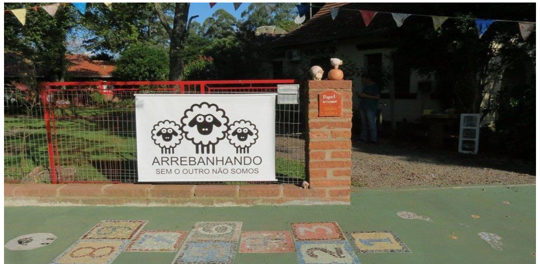
Figura 4. Vista da entrada da rua Fonte: Arrebanhando (2025).

Ao fundo, aparece a residência em que moravam e corresponde à Figura 5, que mostra como ficou com as chuvas. E as imagens mais recentes do que foi possível acessar do lugar, Figuras 6 e 7.