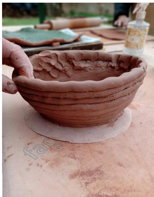
Figura 10. Técnica do acordelado.

A Residência Artística Urbana destacava-se por ser um lugar em que a natureza era exuberante, complementando com a proposta de um ateliê de cerâmica em que os turistas poderiam experimentar uma prática com a argila. A Figura 10 mostra a tecnologia ancestral do acordelado proposto para ser vivenciado pelos visitantes.