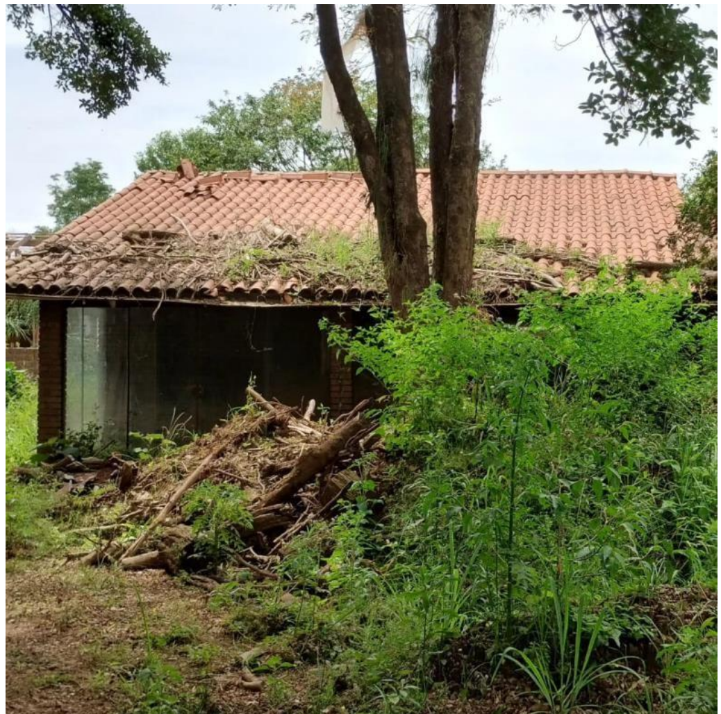
Figura 5. Após a enchente.

Ao fundo, aparece a residência em que moravam e corresponde à Figura 5, que mostra como ficou com as chuvas. E as imagens mais recentes do que foi possível acessar do lugar, Figuras 6 e 7.