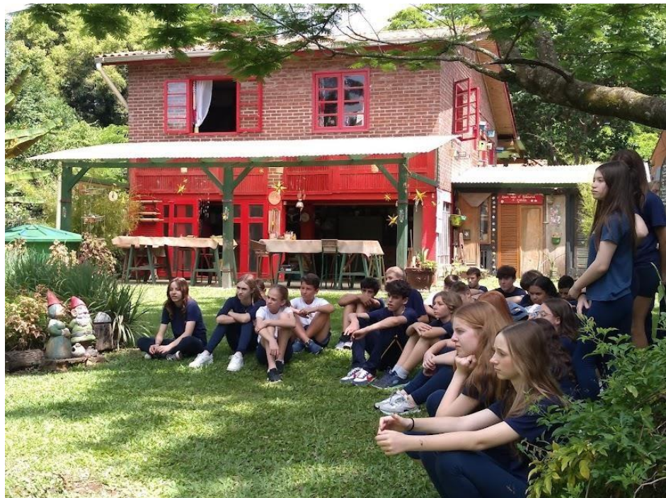
Figura 8. Visita ao Arrebanhando.

Na Residência Artística Urbana, podia-se traduzir o conceito de territorialidade na identificação do lugar, com bandeirinhas coloridas, nas ovelhas de cerâmica sobre o muro, no jogo de amarelinha na calçada, nas pinturas nas paredes, nos anões que pareciam dialogar conosco e também pela figueira e pela paisagem que sensibilizavam os visitantes. O Arrebanhando, enquanto espaço cultural, provocou muitos afetos e afetou muitas pessoas nas descobertas de suas subjetividades e produziu memórias. A Figura 8 apresenta estudantes em visita ao ateliê, enquanto a Figura 9 traduz motivações para estar no lugar.