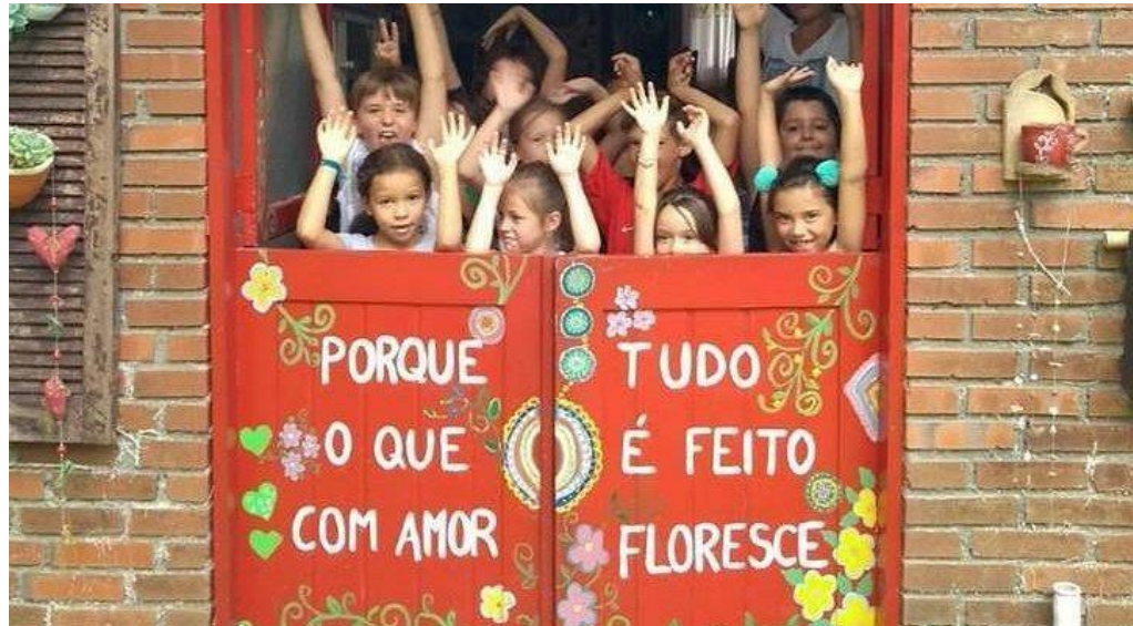
Figura 15.: Atividade realizada com crianças na RAU.

Foram várias as ações educativas como a da Figura 15, em que se vê uma atividade realizada com crianças.