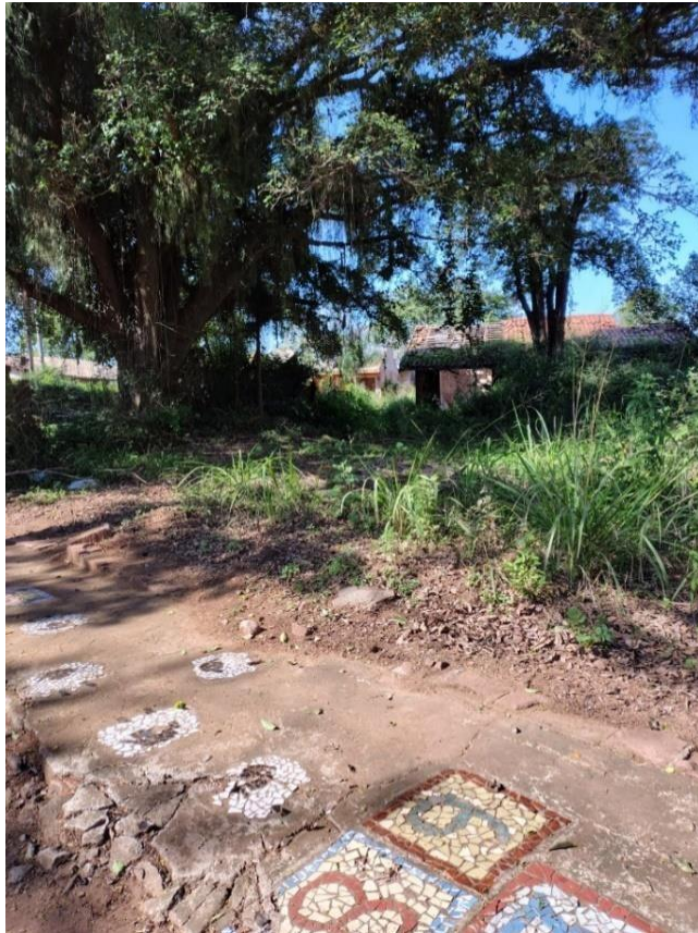
Figura 6. Entrada residência - imagem de julho 2025.