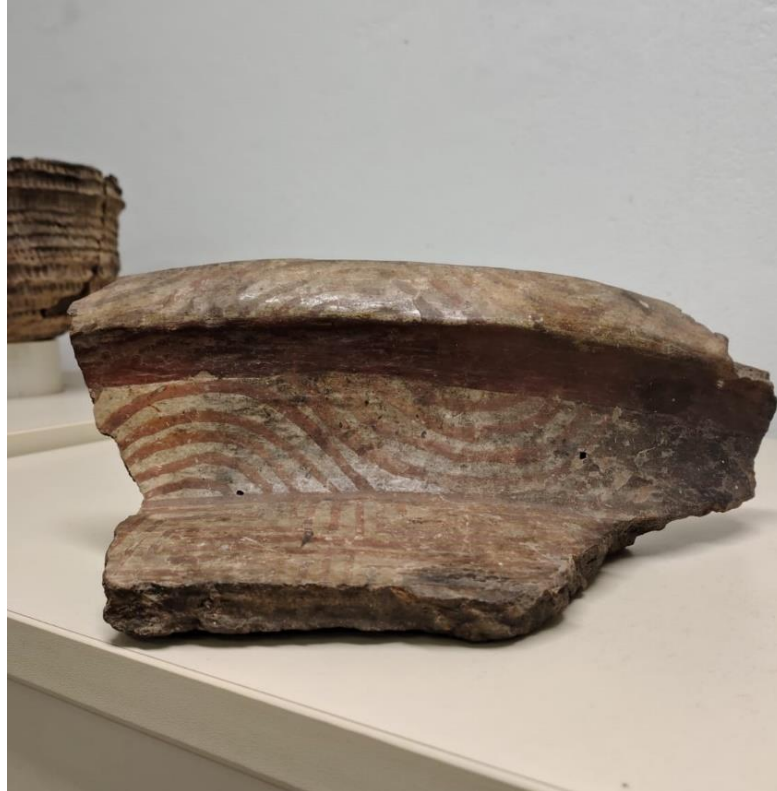
Figura 2. Decoração em vasilha de cerâmica.

Na perspectiva da cultura material, a cerâmica tinha muitas funcionalidades, tanto nos usos domésticos, para a preparação e cozimento de alimentos e para comer e beber, quanto em rituais e cerimônias, através dos preparos das ervas e das urnas funerárias (Figura 3).