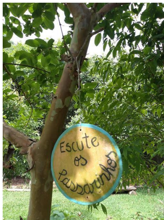
Figura 9. Detalhes do lugar.