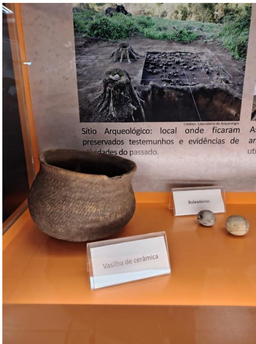
Figura 1. Vasilha de cerâmica.

Em visita ao Laboratório de Arqueologia, do Museu de Ciências da Universidade do Vale do Taquari - Univates, em Lajeado, Rio Grande do Sul, com o objetivo de observar peças cerâmicas produzidas pelas mulheres Guarani (Figuras 1 e 2), encontramos estudos realizados pela equipe do laboratório a partir da cerâmica arqueológica, na região do rio Taquari-Antas e seu afluente Forqueta. São registros sobre a confecção de cerâmica como uma atividade feminina entre os Guarani que utilizavam a técnica “roletada como majoritária, uma mistura de chamote e óxido de ferro como principal tipo de tempero, atmosfera de queima equilibrada, decorações alisadas, corrugadas e unguladas como as mais frequentes, respectivamente, e traços de cerâmica pintada” (Schneider; Machado, 2020, p. 411). Estes estudos são relevantes no entendimento sobre a tecnologia ancestral Guarani e comprovam as marcas deixadas por eles.