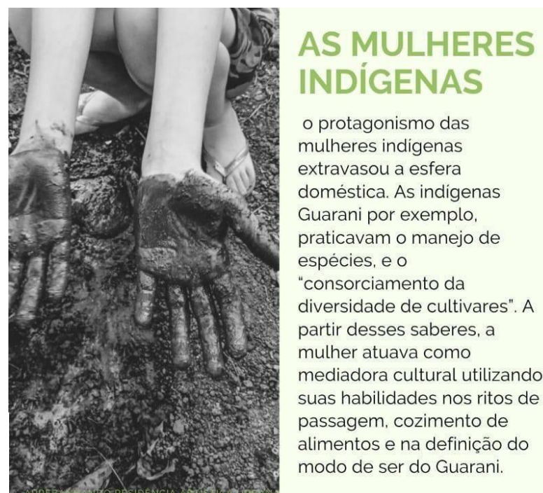
Figura 13.: Destaque para os saberes das mulheres Guarani.

O Arrebanhando ainda aponta para um protagonismo feminino atribuindo à mulher Guarani o papel de mediadora cultural nas suas práticas, conforme a Figura 13.