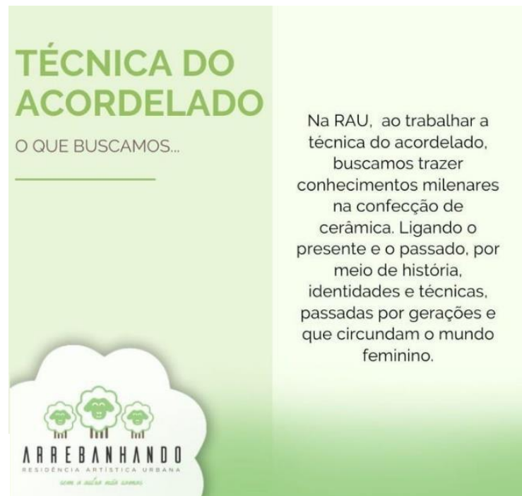
Figura 12. Destaque para a técnica do acordelado.

Considera-se que a RAU seja um agente de educação patrimonial quando diz dessa história, resgata memórias, valoriza a troca de saberes e o patrimônio cultural. Em seu site, encontramos referências aos saberes ancestrais indígenas, conforme destacamos abaixo na Figura 12, como a técnica do acordelado, um dos métodos mais antigos e tradicionais de produção de cerâmica utilizada pela maioria dos grupos indígenas.