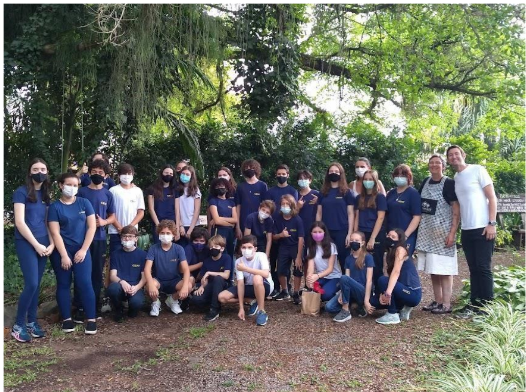
Figura 11. Turma de alunos visitando o Arrebanhando

Fontal Merillas (2022) propõe que o patrimônio cultural seja pautado na formação de vínculos entre o sujeito e o bem cultural numa sequência de verbos que compõem o processo de patrimonialização: conhecer, compreender, respeitar, valorizar, cuidar, usufruir e transmitir o patrimônio. A Figura 11 apresenta um grupo de alunos em visita ao Arrebanhando. Uma possibilidade de movimento em direção ao processo de sensibilização ao patrimônio.