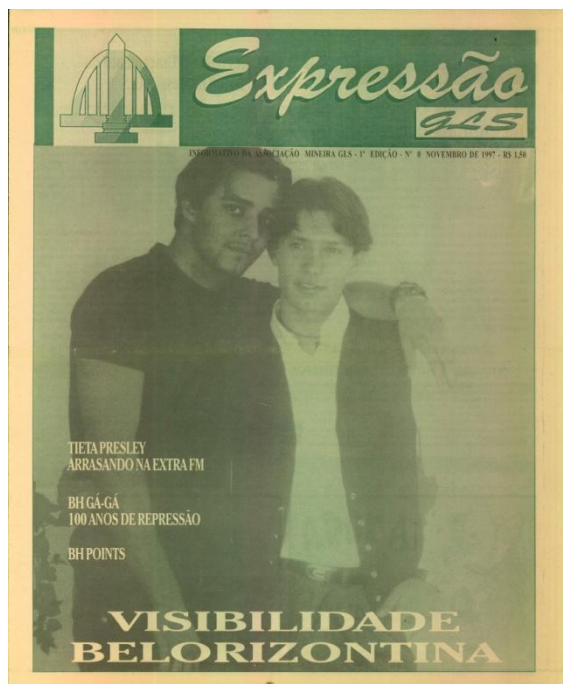
Figura 1. Capa do jornal Expressão GLS , nov. 1997.

A estética construída na primeira página do Expressão GLS não é apenas uma escolha visual, mas um marcador claro das formas de representar as sexualidades dissidentes naquele período histórico. A aposta em uma imagem de dois homens jovens, brancos, abraçados de maneira afetuosa, mas discreta, revela um enquadramento que buscava legitimar a homossexualidade masculina a partir de códigos próximos ao modelo heterocentrado de respeitabilidade.