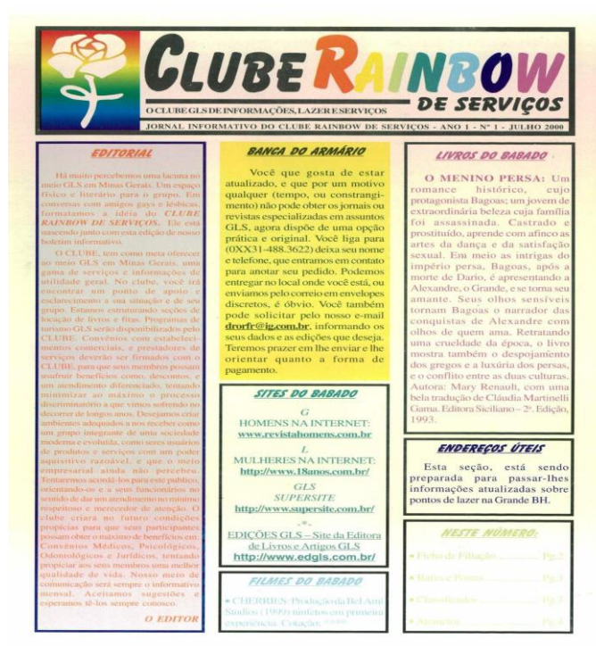
Figura 2. Capa do jornal Clube Rainbow , jul. 2000.

Como observa Carlos Magno, iniciativas como o Jornal Informativo do Clube Rainbow de Serviços e o Bar Só Pra Nós revelam de maneira aguda as contradições internas às formas de organização da “comunidade gay” em Belo Horizonte no início dos anos 2000. Embora o jornal buscasse consolidar um espaço de informação e convivência, articulando serviços, lazer e visibilidade, seu desdobramento na criação de um suposto “Centro de Convivência” destaca o limite dessa proposta. Longe de constituir um espaço comunitário, o bar operava a partir de uma lógica estritamente comercial, caracterizada pela venda de bebidas alcoólicas e pela exploração da mão de obra de trabalhadores gays e lésbicas. Como aponta Fonseca (2020), o fechamento judicial do estabelecimento e as ações trabalhistas movidas por seus funcionários expõem a tensão entre discurso de acolhimento e práticas que reproduzem desigualdades estruturais.