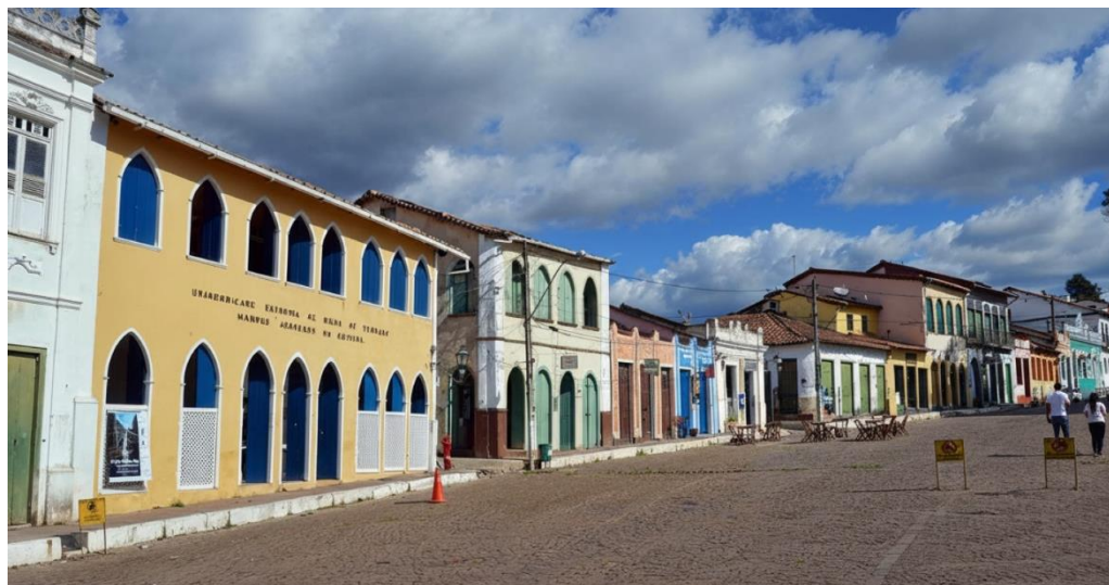
Figura 2. Fotografia Praça Horácio de Matos

Tal característica foi comprovada com a visita de campo e pelas imagens fotográficas do casario da praça Horácio de Matto de Lençóis: