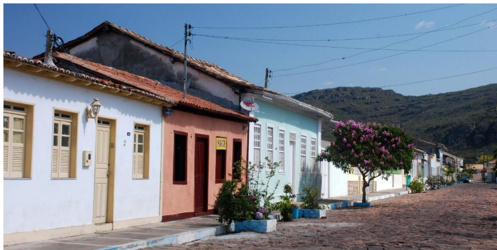
Figura 3. Fotografia Casario de Mucugê (19 de março de 2014)

A análise visual das casas corrobora com tais características arquitetônicas: