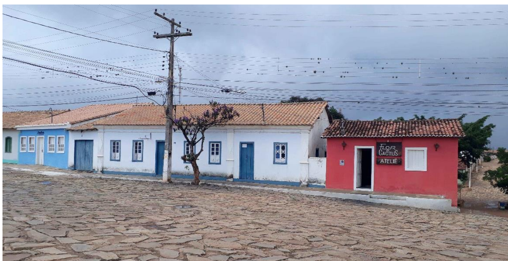
Figura 4. Fotografia Casario centro histórico Rio de Contas, BA Autor: Friduxa. Casario localizado no centro histórico de Rio de Contas, BA Disponível em: https://commons.wikimedia.org/wiki/Category:Rio_de_Contas_(Bahia)/#/media/File:Casario_centro_hist%C3%B3rico_Rio_de_Contas_BA.jpg Acesso em 17 nov.2023. Arquivo de Acesso livre. Este arquivo está licenciado sob a licença Creative Commons Atribuição-Compartilha Igual 4.0 Internacional .

Em síntese, a análise de Lençóis, Mucugê e Rio de Contas demonstra que o casario de tradição colonial da Chapada Diamantina é indissociável da técnica de pau a pique ou taipa de mão, ligados a uma arquitetura de tradição colonial referente aos ciclos de ouro e diamantes, da formação de núcleos urbanos vinculados ao garimpo e da ampla circulação de trabalhadores, em grande medida escravizados ou submetidos a formas de trabalho compulsório.