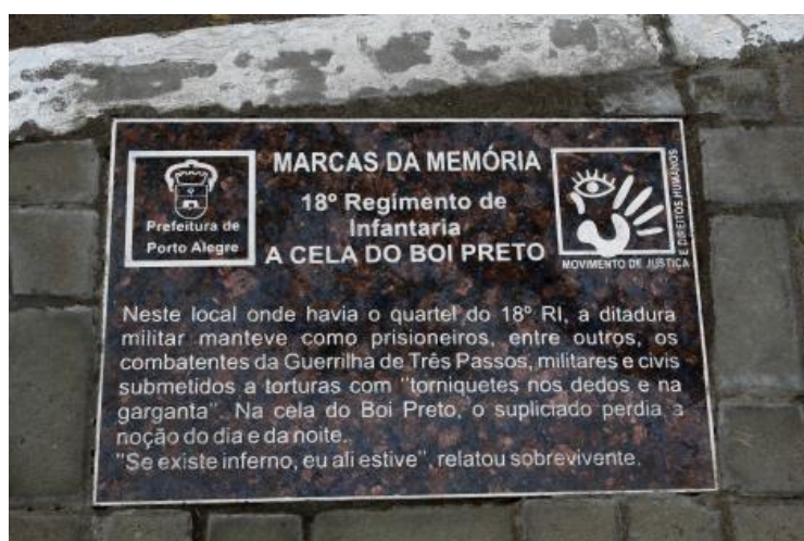
Figura 3. Placa afixada na calçada da Av. Bento Gonçalves, 4592, onde se localizava o 18º Regimento de Infantaria, o local também é conhecido como “Cela do Boi Preto”.

Assim, no projeto “Marcas da Memória” foram afixadas dez placas nos seguintes lugares: Dopinho (R. Santo Antônio, 600); Praça Raul Pilla (Quartel da 6ª Companhia de Polícia do Exército); Colégio Estadual Paulo da Gama (serviu como prisão); Palácio da Polícia (DOPS); Fundação de Atendimento Socioeducativo (serviu como prisão); Quartel do 18º Regimento de Infantaria (Av. Bento Gonçalves, 4592); Presídio Central; Presídio Feminino Madre Pelletier; Cais da Vila Assunção (Av. Guaíba, 154); e, Praça Harald Edelstam (única placa em um local que busca homenagear uma pessoa, o diplomata Gustav Harald Edelstam, reconhecido pelo trabalho na defesa dos direitos humanos). Cada uma delas apresenta uma breve explicação da relação daquele espaço com a história da ditadura, como mostrado na figura abaixo.