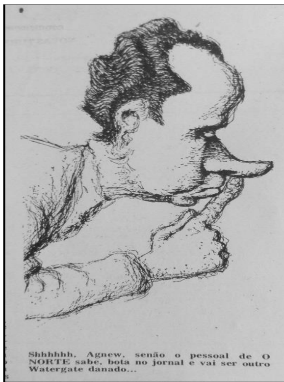
Imagem 4. primeira charge diária publicada no jornal O Norte em 11 ago.1973.