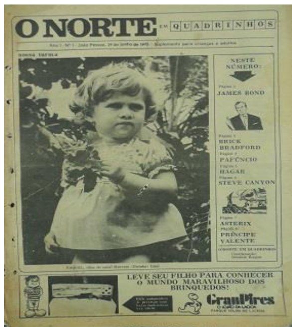
Imagem 10. Capa do suplemento O Norte em Quadrinhos . Ano1, nº 1. 29 jun. 1975