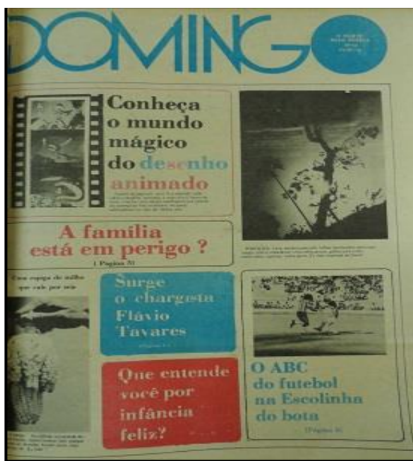
Imagem 9. capa do suplemento Domingo, nº 32, de 11 jul. 1976.