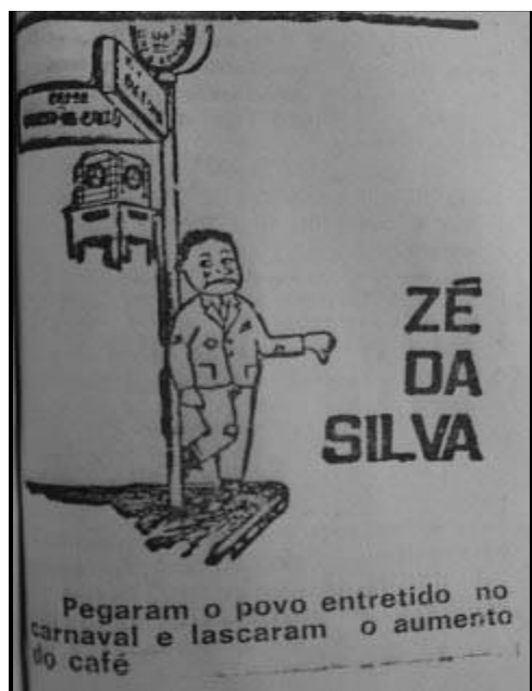
Imagem 2. Desenho de Zé da Silva, edição de O Norte , em 02 fev.1970.