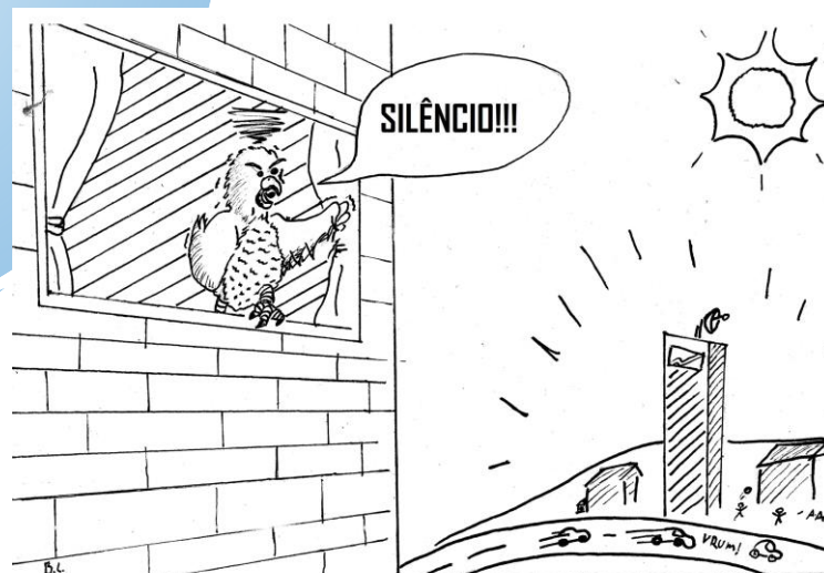
Figura 1. O morador incomodado. Fonte: Ilustração de Bruno da Conceição Luiz.

Uma vocalização é formada por pequenas unidades sonoras, chamadas de elementos; o conjunto de elementos agrupados formam uma sílaba, e a junção de várias sílabas formam o motivo (Figura 2). O repertório é importante para a sobrevivência das aves, como encontrar seus filhotes, parceiros para se reproduzir, defender seu território, avisar sobre predadores, dentre outros.